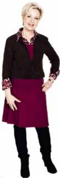
SUVI LINDÉN kommunikations- minister