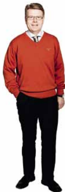
JYRI HÄKÄMIES försvarsminister

om vi vill rädda det finländska välfärdssamhället och skapa en allt bättre välfärd.