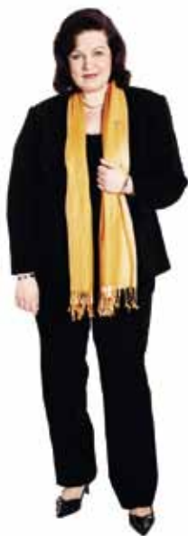
ANNE HOLMLUND inrikesminister

»Vi måste satsa på att bygga högklassigt och utveckla boendemiljöerna - var och hur man bor påverkar hur vi alla trivs i vardagen.»