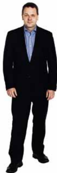
JAN VAPAAVUORI bostadsminister

ländare är som bäst när utmaningarna är stora och vi måste bära ansvar.