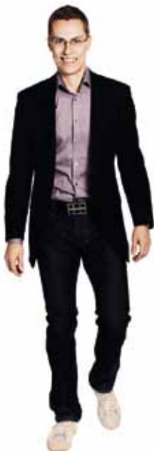
ALEXANDER STUBB utrikesminister