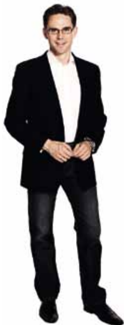
JYRKI KATAINEN finansminister Samlingspartiets ordförande

»För att förebygga ungdomsarbetslöshet och utslagningsbehöver vi styra ungdomar till utbildning och arbetsliv med ett fastare grepp.»