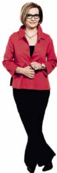
PAULA RISIKKO omsorgsminister