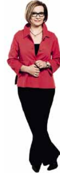
PAULA RISIKKO peruspalveluministeri