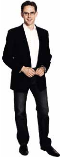
JYRKI KATAINEN valtiovarainministeri

»Nuorisotyöttömyyden ja syrjäytymisen ehkäisemiseksi tarvitsemme voimakkaampaa otetta nuorison ohjaimiseen koulutukseen ja työelämään.»