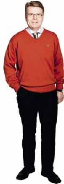
JYRI HÄKÄMIES puolustusministeri

pungeissa ja maaseudulla. Olemme vaihtaneet ajatuksia Suomen nykytilasta ja maamme tulevaisuudesta. Puolin ja toisin on kuunneltu ja kysely, oltu joistain asioista eri mieltä ja toisista samaa mieltä.