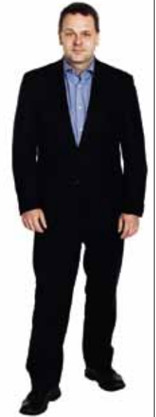
JAN VAPAAVUORI asuntoministeri

misen henkeä. Tarvitsemme erilaisia ajatuksia. Kenenkään ääni ei saa jäädä kuulematta.