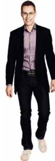
ALEXANDER STUBB ulkoasiainministeri