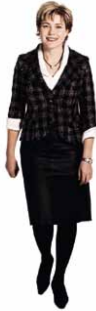
HENNA VIRKKUNEN opetusministeri