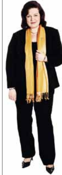
ANNE HOLMLUND sisäasiainministeri

»Rakentamisen laatuun ja asuinympäristöjen kehittämiseen on panostettava – sillä, miten ja missä asumme, on merkitystä meidän kaikkien hyvään arkeen.»